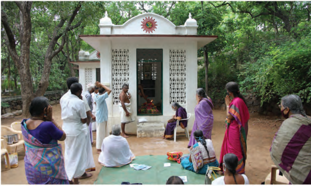
6/9/2021 ஸ்ரீ ரமணாஸ்ரமத்தில் நடைபெற்ற முருகனார் ஆராதனை