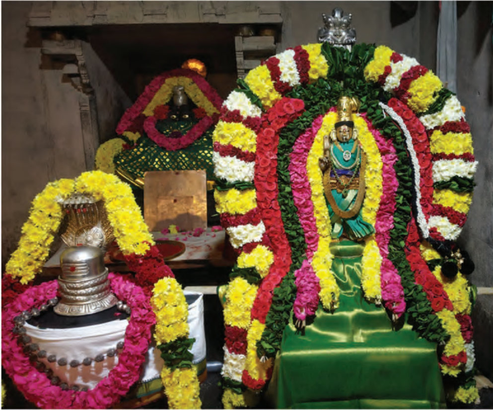
நவராத்திரி விழா (2021) அலங்காரத்தில் அன்னை யோகாம்பாள் - ஸ்ரீ ரமணாஸ்ரமம்