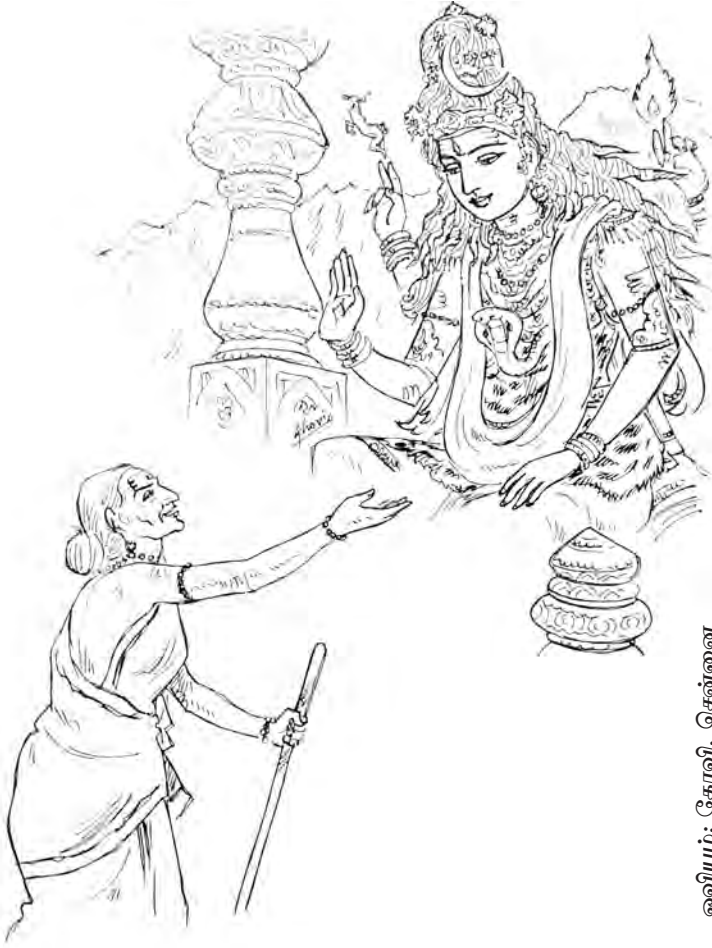
ஓவியம்: கோவி, சென்னை