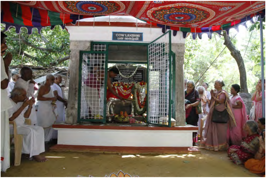
28-6-2015 ஞாயிற்றுக்கிழமை ஸ்ரீ ரமணாச்சரமத்தில் நடைபெற்ற பசு லக்ஷ்மி ஆராதனை தினக் காட்சிகள்