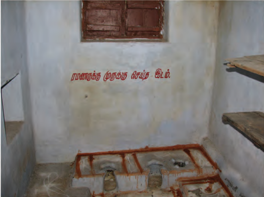
ரமண மடாலயம், தேசூர்