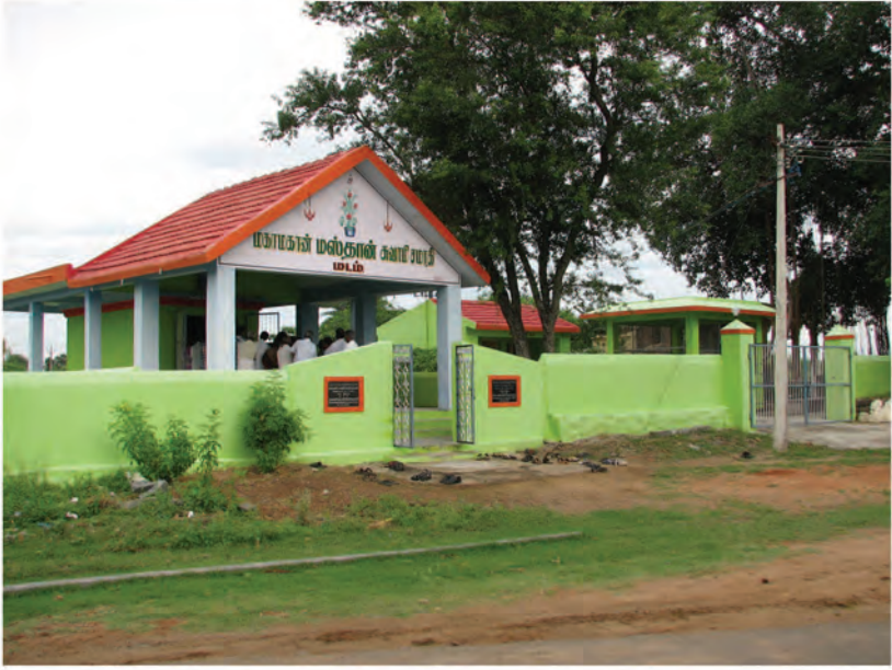
மகான் மஸ்தான் சமாதி ஆலயம், மடம் கிராமம்