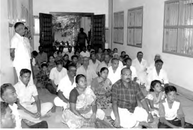
முருகனார் மந்திரம், கிராமநாதபுரம்