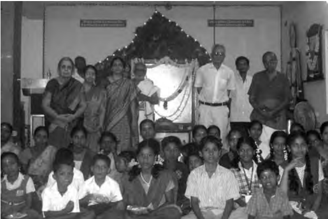
ரமண கேந்திரம், சென்னை

சென்னை ரமண கேந்திரம் சார்பாக, கடந்த 16 ஆண்டுகளாக கல்வி உதவித்தொகையாக ஏழை மாணவ மாணவிகளுக்கு அளிக்கப்பட்டு வருகின்றது. இவ்வாண்டு 17/6/2012 அன்று 31 ஏழை மாணவ மாணவிகளுக்கு தலா ரூபாய் ஆயிரம் வீதம் வழங்கப்பட்டது. இவ்விழாவின்போது அக்ஷரமணமாலை கூட்டுப் பாராயணத்திற்குப்பின் அனைவருக்கும் பிரசாதம் வழங்கப்பட்டது.