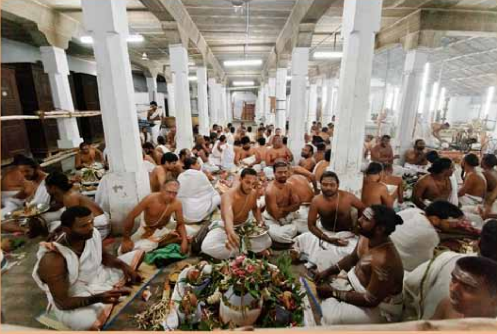
அதிருத்ர மகாயக்ஞம் ஓயாமடம்