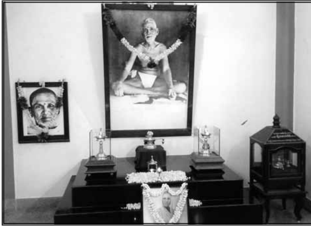
முருகனார் மந்திரம், இராமநாதபுரம்

அன்னை அழகம்மையின் மகாபூஜை 26/5/2011 அன்று ஸ்ரீரமணாச்சரமத்தில் எப்பொழுதும் போல் சிறப்பான முறையில் நடைபெற்றது. இவ்விழாக்கள் மதுரை மற்றும் திருச்சுழியிலும் சிறப்பாக நடைபெற்றன.