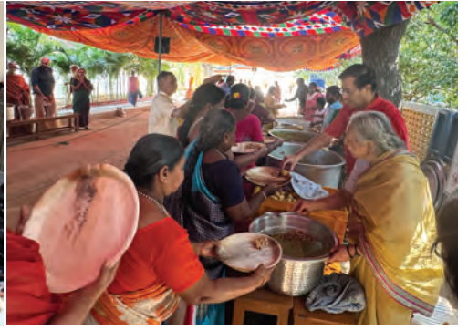
146 ஆவது ரமண ஜயந்தி தின காட்சிகள் – ஸ்ரீ ரமணாஸ்ரமம், திருவண்ணாமலை