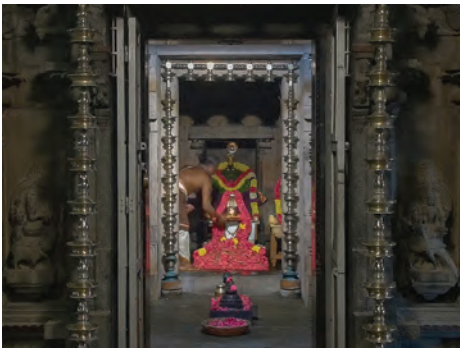
21 மார்ச் 2025 வெள்ளிக்கிழமையன்று ஸ்ரீ ரமணாஸ்ரமத்தில் நடைபெற்ற ஸ்ரீ வித்யா ஹோமக் காட்சிகள்