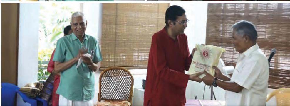
குரோம்பேட்டை ரமணாலயத்தில் 9/3/2025 அன்று நடைபெற்ற புனர்வசு தின சிறப்பு நிகழ்ச்சிகளின் தொகுப்பு